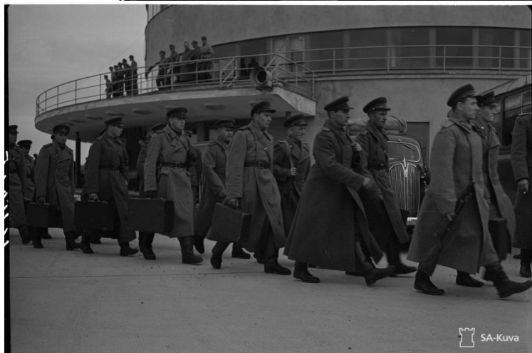
Valvontakomissio marssii kentältä Hotelli Torniin