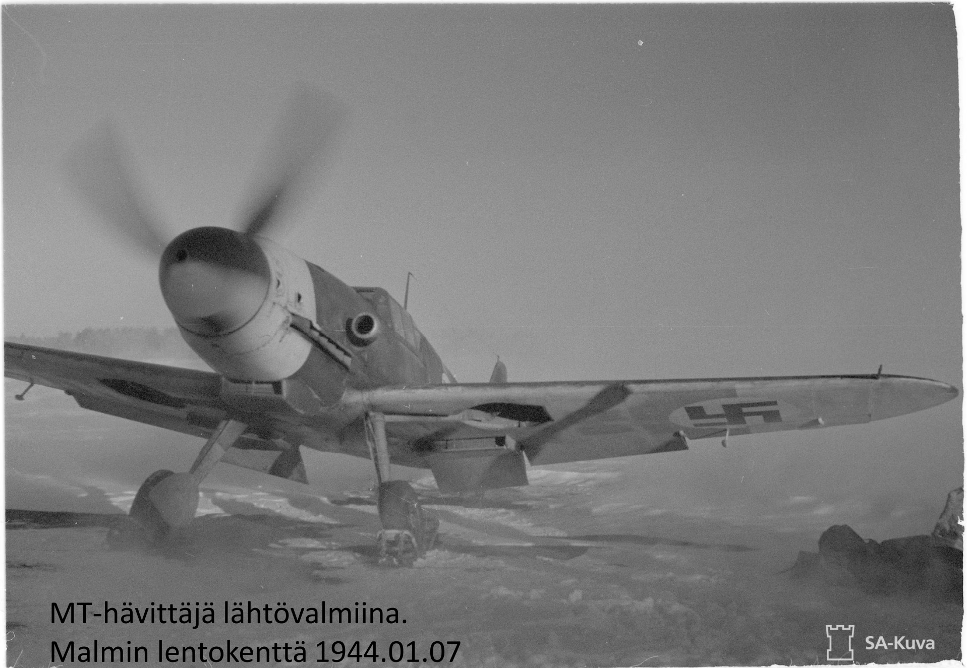
MT-hävittäjä lähtövalmiina. Malmin lentokenttä 1944.01.07